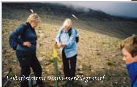
Leiðafóstrarmir vinna merkilegt starf