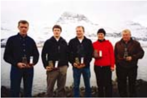
Fjallagarpar 2004 Verðlaun afhent á aðalfundi 2005. Hádegisfjallið í baksýn

með ykkur gesti úr öðrum byggðum. Fjallgöngur eru ekta fjölskyldusport. Fátt jafnast við þá tilfinningu að njóta útsýnis og fersks fjallalofts eftir hressandi göngu og nokkra fyrirhöfn.