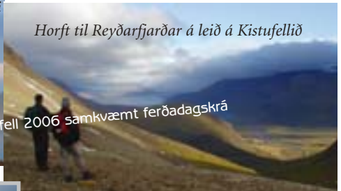
Horft til Reyðarfjarðar á leið á Kistufellið

Upplýsingar um „Fjöllin fimm” í Fjarðabyggð á heimasíðu félagsins simnet.is/ffau Nálgist stimpilhefti, vinnið afrek og njótið fjallanna. Góða ferð