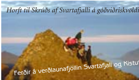
Horft til Skruðs af Svartafjalli á góðviðriskvöldi