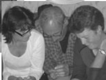
Spáð í steina